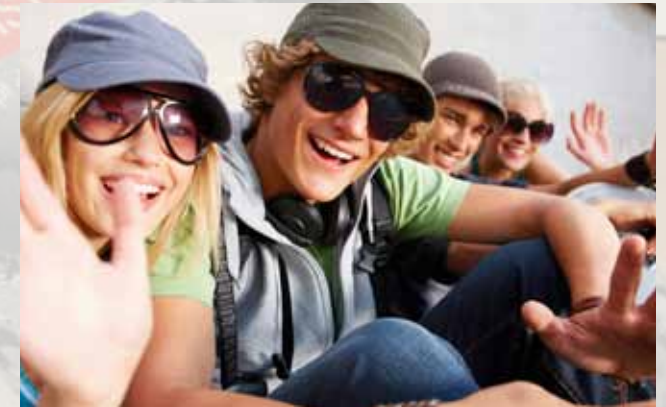
Pädagogische Ausbildung zum Jugendleiter beim Landesjugendwerk der AWO